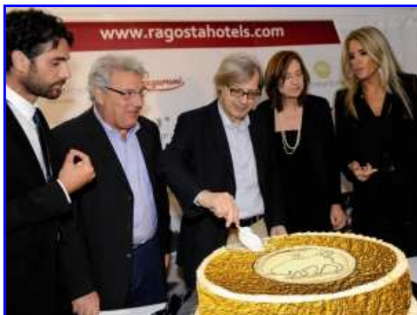
Calvani, Sacco, Sgarbi, Young e Rocca

Taormina. Anche quest'anno immancabile serata glamour presso il La Plage Resort, in collaborazione con Taormina Arte, organizzatore del Taormina Film Fest che ha condotto nella capitale siciliana del turismo importante attori, registi e protagonisti del cinema a livello mondiale. All'appuntamento di lunedì sera, sull'incantevole terrazza del La Plage Resort egregiamente diretto da Giuseppe Marchese, di fronte Isolabella, alcuni tra i protagonisti simbolo di questo Festival come Oliver Stone e Matthew Modine, accompagnati da Deborah Young, la famosa critica cinematografica a cui è affidata la direzione artistica del Taormina Film Fest. Tra le attrici italiane presenti alla serata c'erano Giuliana De Sio e Maya Sansa, mentre tra i tanti ospiti anche il Principe Giovannelli, Vittorio Sgarbi, Tiziana Rocca e Nino Strano, solo per citarne alcuni. Il menù della serata, curato personalmente dallo chef Giorgio Rimmaudo, ha deliziato gli ospiti con piatti a base di pesce ispirati alla cucina fusion ovvero piatti della tradizione siciliana rivisitati in chiave moderna per esaltare ancora di più le prelibatezze del territorio siciliano. La serata si è conclusa con una torta di 15 kg (realizzata sempre dallo chef Giorgio Rimmaudo), decorata in oro alimentare per riprodurre fedelmente il simbolo della manifestazione: un'antica moneta d'oro con un toro disegnato sopra.