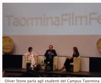
Oliver Stone parla agli studenti del Campus Taormina

Alexander è il secondo film indipendente più costoso della storia , fortemente criticato negli USA, ma che ha solcato la Top 20 delle classifiche estere; Stone lo annovera tra i progetti folli in cui spesso i registi si cimentano, nati male ma destinati a migliorare nel tempo. Si dichiara essere un drammaturgo prima di tutto e non giustifica l'ottusità di chi non riesce a vedere il film come puro intrattenimento.