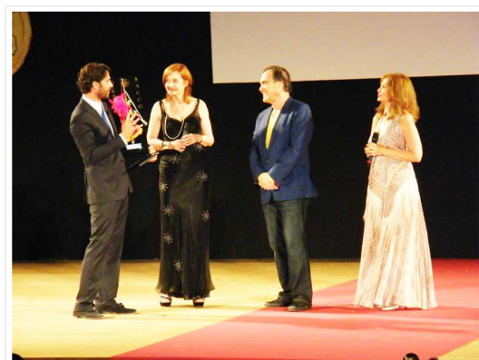
Oliver Stone ritira il Taormina Arte Award