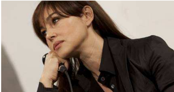
Monica Bellucci a Taormina

Prossime uscite Trovacinema Schede e Trailer Foto di scena News RadioCinema Immagini Videogallery